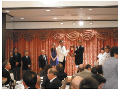
GVキーの交換 市川GVから濱野エレクトへ