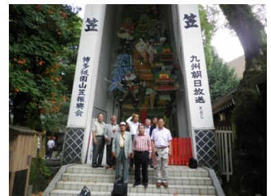
巨大な山笠の前で