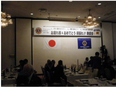
ガバナーズナイト