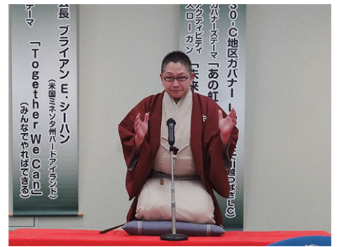
真打 春風亭 昇也 様 落語家