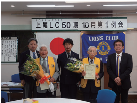
チャーターメンバーに花束贈呈