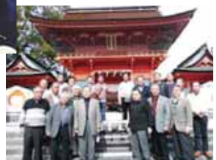
富士山本宮浅間大社で