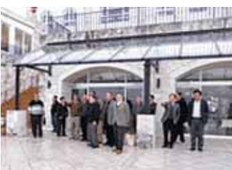
伊豆ワイナリーにて