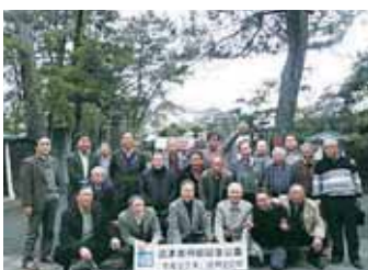
沼津御用邸で・・・

今年度の移動例会は伊豆修善寺のホテル桂川への一泊の旅。前年度、前々年と二年続けて東北大震災の被災地訪問の移動例会でしたが、今回は伊豆の温泉にて日頃の疲れを癒す？移動例会でした。