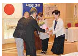
新三役レディーへ花束