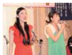
ボーカルユニット 「ダイアナ・ブルー」