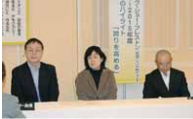
上尾市聴覚障害者協会・上尾市手話通訳研究会