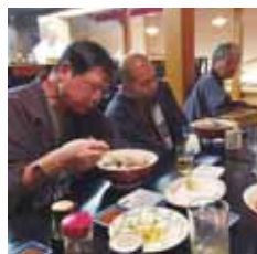
伊豆の 温泉宿にて