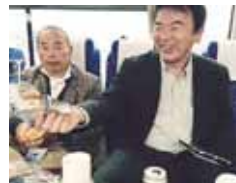
バスの中も 和やかに