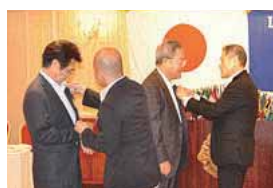
役員バッチ引き継ぎ