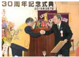
上尾中央LC 上尾LC両会長握手