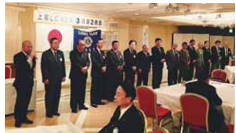
次期役員候補者の発表

次年度役員候補者が報告され、4月第一例会の選挙会 の承認により愈々43年度のスタートの準備に入ります。 卓話はL. 伊巻による「マイナンバー制度」についての 説明がありました。