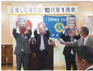
LCIF 1,000$献金・MJFパッチ贈呈