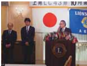
大宮北ライオンズクラブ三役