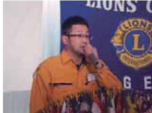
埼玉レスキューLC浦中会長