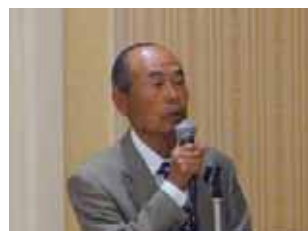
L. 三角 隆