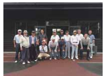
第3回鴻巣カントリー