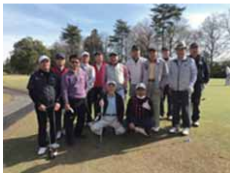
第2回猿島カントリー