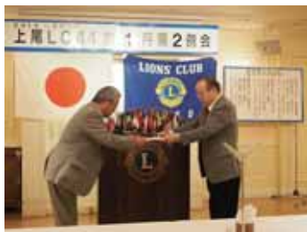
全メンバー 20$ 献金感謝状贈呈