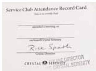
伊藤Lが旅客船の中で発行された例会出席カード