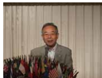
前役員・理事・地区役員