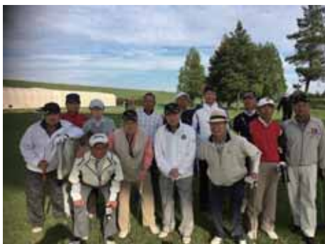
第1回大宮カントリー