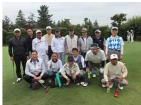
第3回鴻巣カントリー