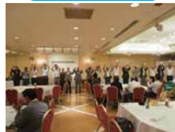
ライオンズローア